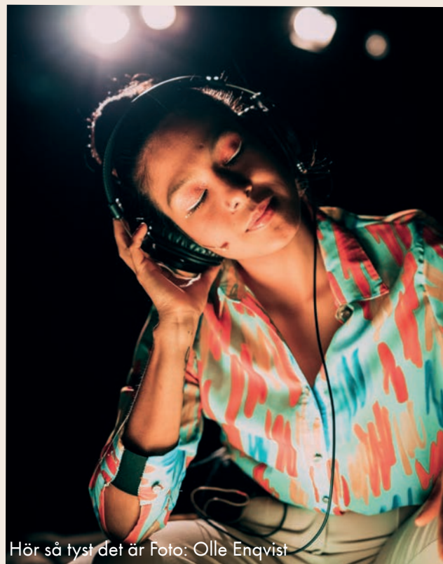
Hör så tyst det är

Det blir fantastiska personporträtt som berör på djupet.