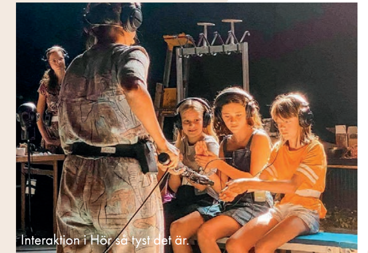
Interaktion i Hör så tyst det är.

uppleva och utforska en ljudvärld i sitt eget tempo, samtidigt som vi delade upplevelsen tillsammans med andra. Det blev en unik kombination som vi är väldigt stolta över. Det pedagogiska arbetet följde sömlöst upp scenkonstupplevelsen och erbjöds till alla arrangörer.