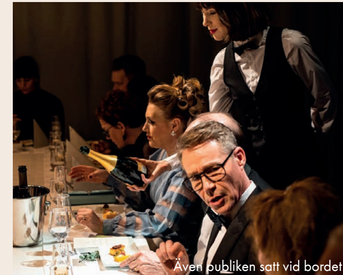
Även publiken satt vid bordet.

Regionteaterns Festen blev en otroligt stark teaterupplevelse som alldeles för få fick se. Det blev en storslagen skådespelarföreställning och totalupplevelse med en spännande form som fick publiken att ingå i verket, och som verkligen var värd Regionteaterns 50-års-jubileum. Vi ville berätta en historia som verkligen berörde på djupet och som faktiskt kunde göra skillnad.