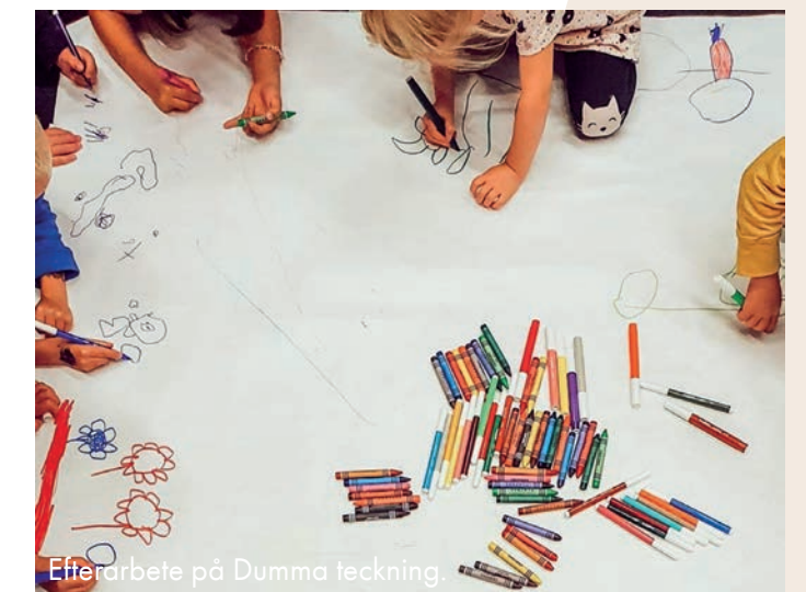
Efterarbete på Dumma teckning.

Barnen fick rita och tänka kring det de själva skapade, i en scenkonstupplevelsens epilog där eget utövande stod i centrum.