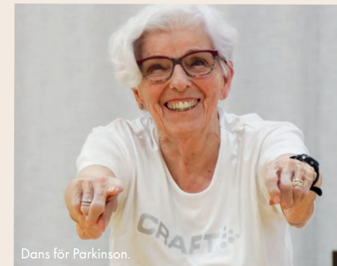
Dans för Parkinson.

• Dans för Parkinson Under första delen av våren träffades kursdeltagarna fysiskt, men kursen ställdes om till digital dans under andra halvan av våren. Kursen fortsatte sedan digitalt under hela hösten.