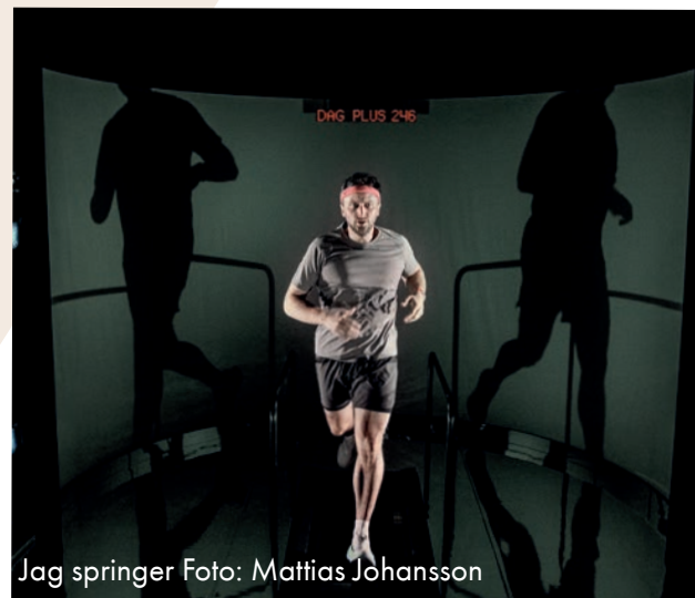
Jag springer