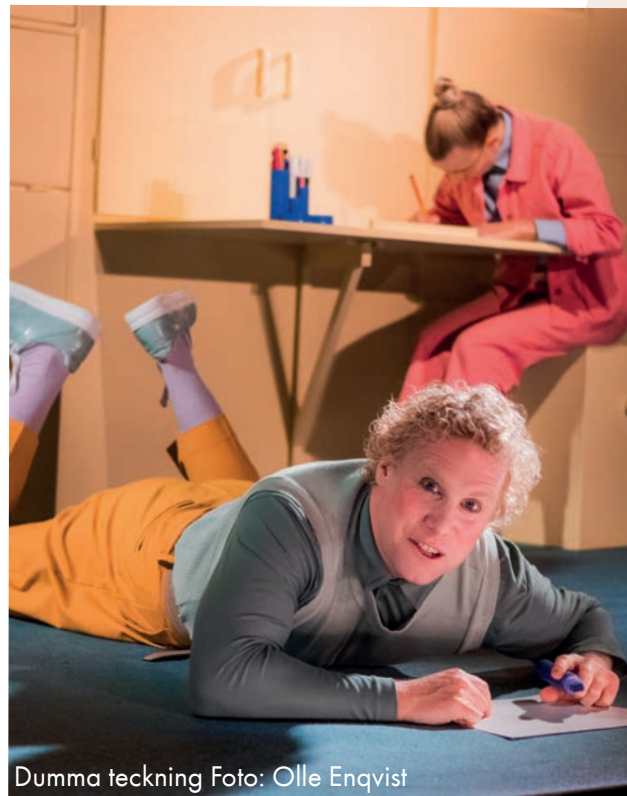
Dumma teckning