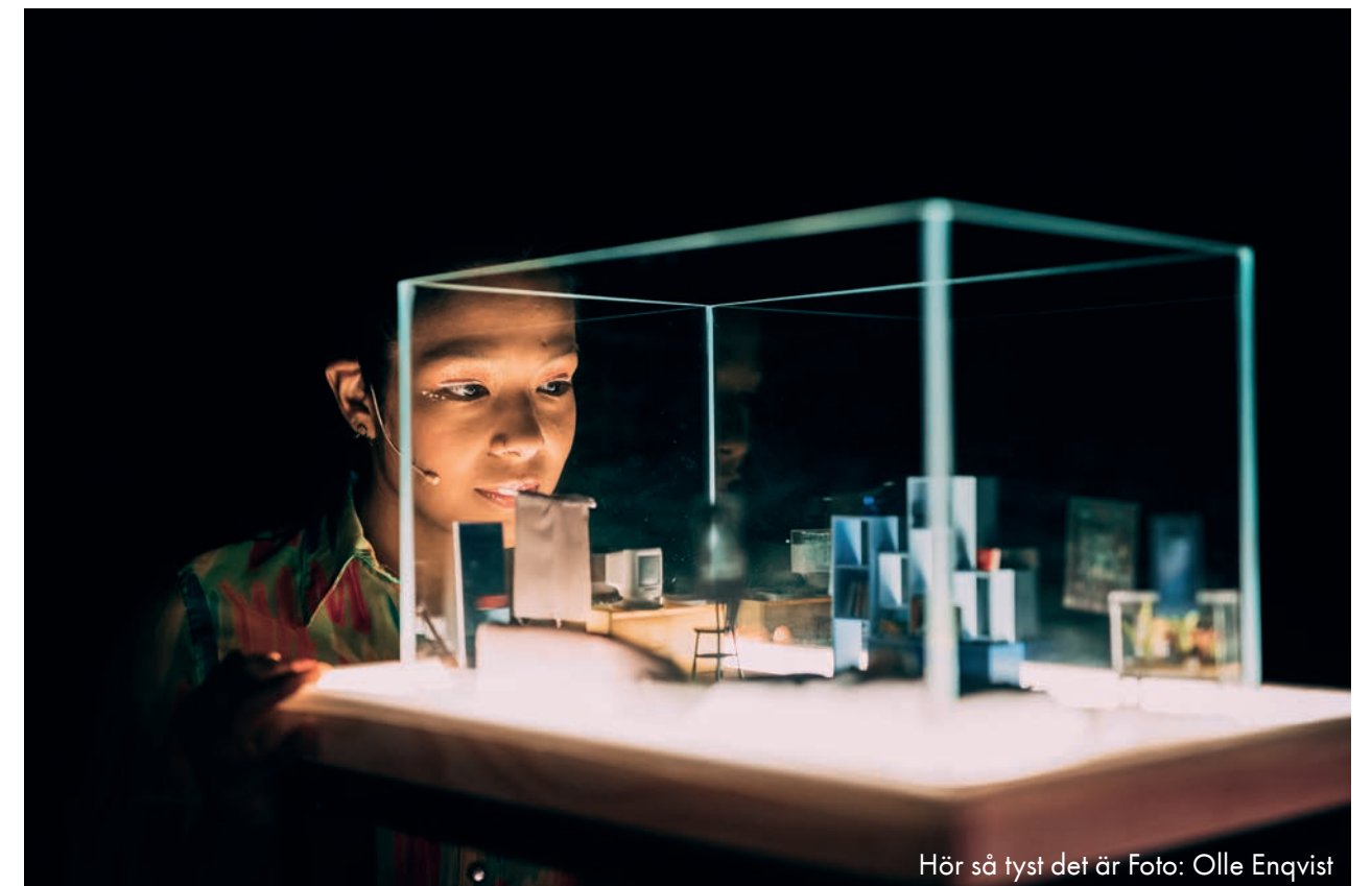
Hör så tyst det är