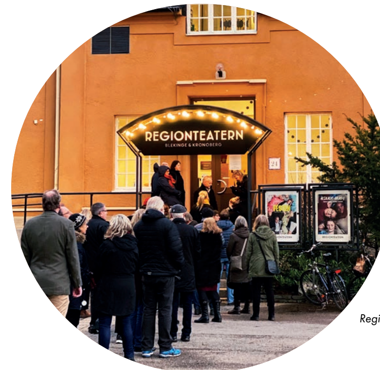
Regionteaterns entré, Kulturnatten januari 2020.