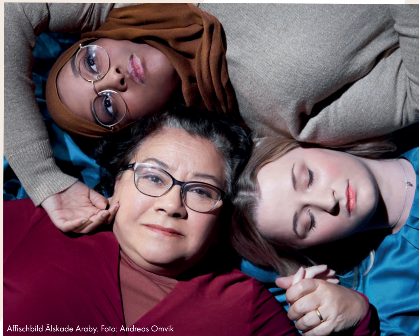
Affischbild Älskade Araby.