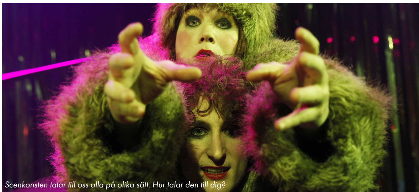
Scenkonsten talar till oss alla på olika sätt. Hur talar den till dig?