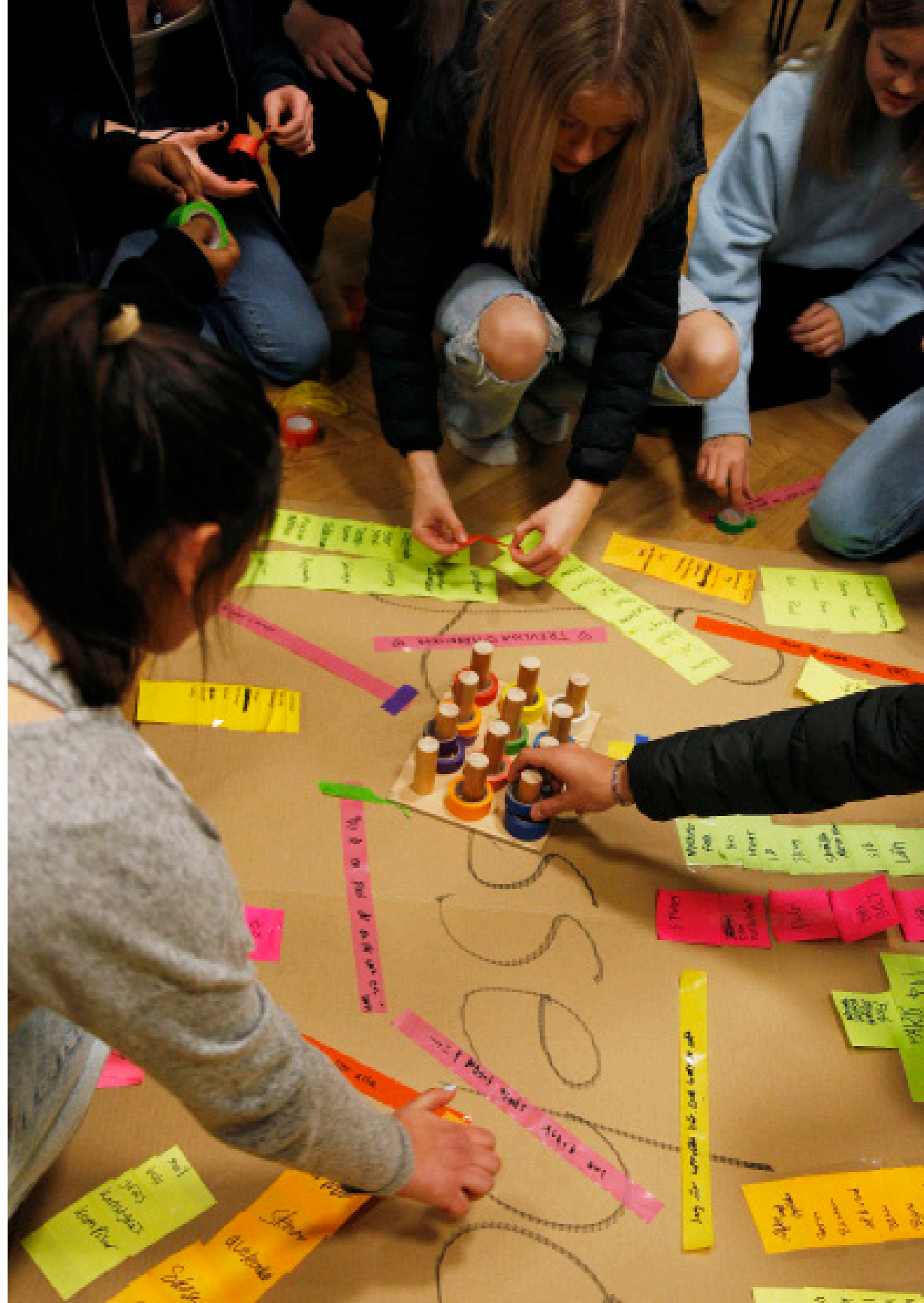
Bild- och musikproduktions elever ställde ut.

Dagarna bjöd på fyra större föreställningar producerade av teater- och dans inriktningen. Dessutom två blandprogram i Scenkonstbaren.